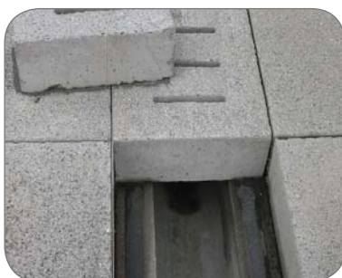
Stavba Hlavná stanica v Klagenfurte /A/ Vrchný kryt od Firmy Ebenseer