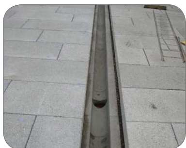
Stavba Hlavná stanica v Klagenfurte /A/