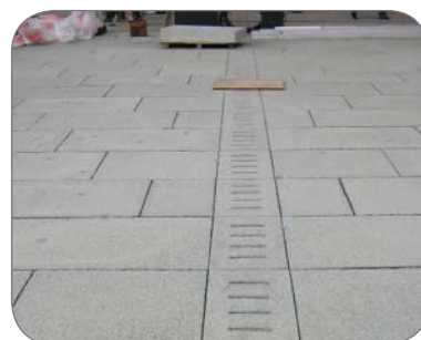
Stavba Hlavná stanica v Klagenfurte /A/ Vrchný kryt od Firmy Ebenseer