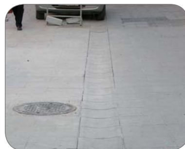
Stavba Herrengasse v Grazi /A/ Vrchný kryt od Firmy Poschacher