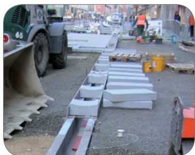
Stavba Herrengasse v Grazi /A/ Vrchný kryt od Firmy Poschacher

Ceny na požiadanie. Pri tomto výrobku prosíme zohľadniť možný dlhší dodací termín!