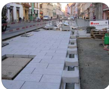
Stavba Herrengasse v Grazi /A/ Vrchný kryt od Firmy Poschacher